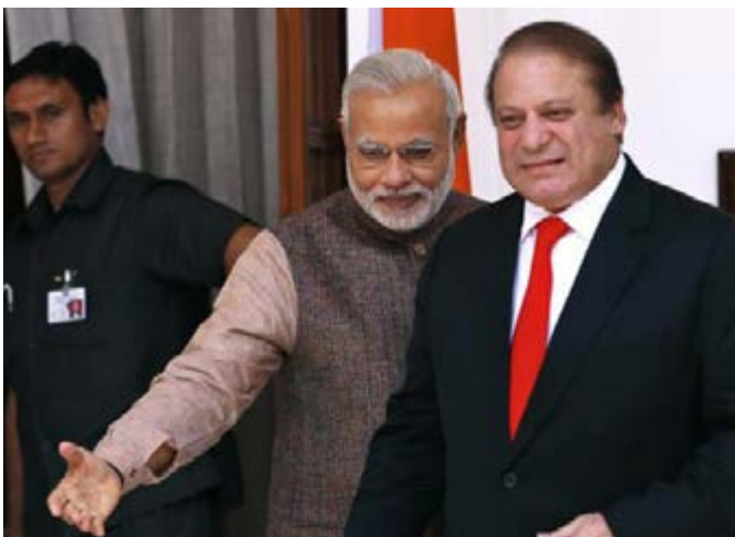
نخست‌وزیر هند دعوت همتای پاکستانی خود را برای سفر به این کشور در سال آتی میلادی به عنوان نخستین بار پذیرفت که این امر نخستین نشانه میان این دو رقیب محسوب می‌شود.

اما در بیانیه‌ی آمده است که شریف از سفر به روسیه به عنوان فرصتی برای تاکید مجدد درخواستش از مودی برای حضور در این نشست استفاده کرده و مودی هم دعوت وی را پذیرفته است. این نخستین بار است که مودی به پاکستان می‌رود.